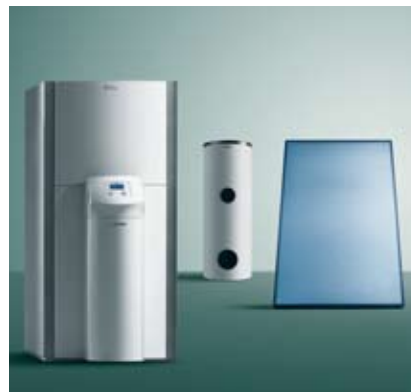
zeoTHERM - Vaillant on kehittänyt maailman ensimmäisen zeoliittikaasulämpöpumpun, joka käyttää ympäristöystävällistä zeoliittia lämmityksessä. Se vähentää polttoaineen kulutusta ja päästöjä 20 prosentilla.