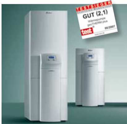
geoTHERM - Vaillant maalämpöpumput: paras luokassaan sarjassa energiatehokkuus ja voittaja vertailutestissä Saksan kuluttajaviraston vertailutestissä.

Menestyksemme perustuu tutkimukselle ja tuotekehitykselle. Vuoden 2009 loppuun mennessä kaiken kaikkiaan 530 työntekijää työskenteli tutkimuksen ja tuotekehityksen parissa. Sen vuoksi Vaillant Group omaa yhden suurimmista tutkimus- ja tuotekehitystiimeistä koko alalla. Pääpaino tuotekehityksissä on tuotteissa, jotka perustuvat uusiutuvan energian lähteisiin, kuten maalämpöpumput, aurinkoenergialaitteet ja hybridiratkaisut.