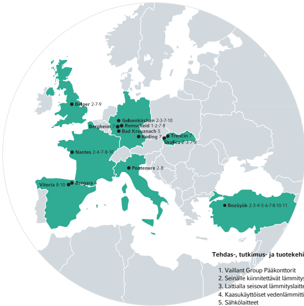
Tehdas-, tutkimus- ja tuotekehitysalueet