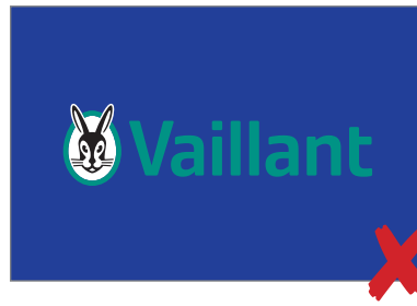
Das Logo sollte nicht auf Untergründen stehen, auf denen das Grün nicht genügend Kontrast bietet. The logo must not appear on backgrounds that lack sufficient contrast with the green.