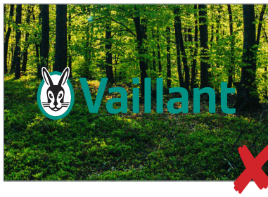
Das Logo mit grüner Wortmarke sollte nicht auf Fotos stehen, auf denen das Grün nicht genügend Kontrast bietet. The logo with a green word mark should not be used on images that don't contrast sufficiently with the green.