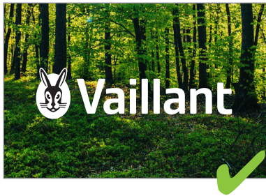
Das Logo für die Darstellung auf dunklen Fotografien, auf denen das Grün nicht genügend Kontrast bietet. The logo for use on dark images on which green lacks sufficient contrast.