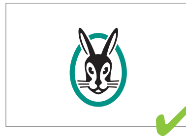
Die Bildmarke darf nur in definierten Einzelfällen alleine stehen. The design mark may only stand alone in defined individual cases.